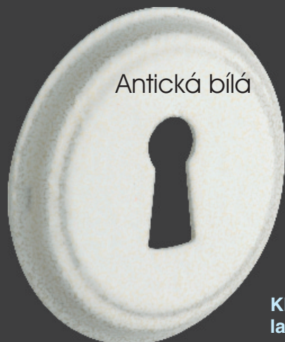
Kliky a štítky lakované práškovou barvou.