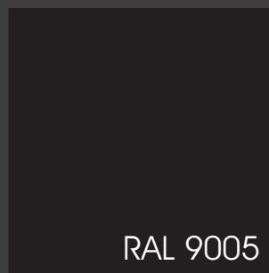
Zakázkový povrch černá barva