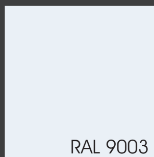
Zakázkový povrch bílá barva