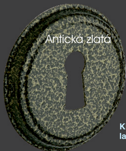
Kliky a štítky lakované práškovou barvou.