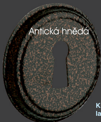
Kliky a štítky lakované práškovou barvou.